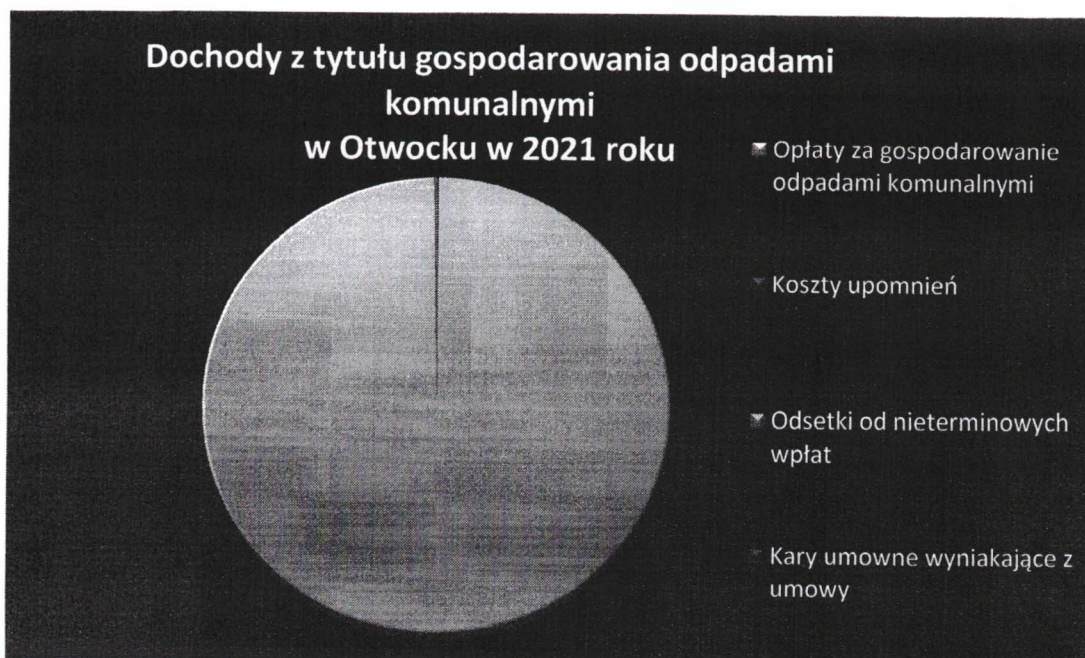
Diagram 2 Dochody z tytułu gospodarowania odpadami za 2021 rok